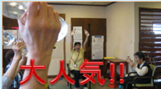
大人気!! ペットボトル体操♪