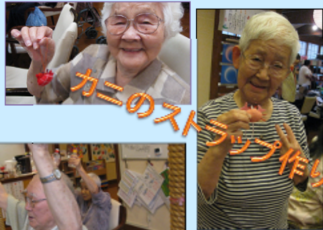
カニのストロー作り