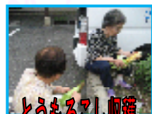
とうもろこし収穫