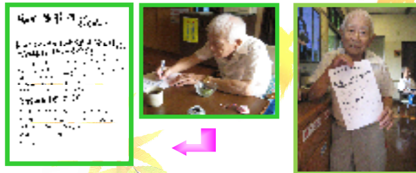
↑堀田様が直筆で書いて下さいました♪

■今後の目標は?? 初めここへお世話になった時は杖なしでは歩けなかったのに最近は少しぐらいの距離は杖無しで歩ける様になりました。もっと頑張って杖無しで歩ける様になりたいのが目標です。